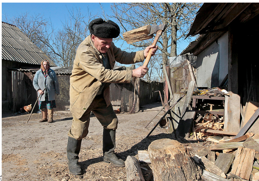
TRENTA ANYS DESPRÉS. A l'esquerra, camions amb "líquid descontaminant" entren a Txernòbil, un mes i mig després de l'accident (juny de 1986). A la dreta, una imatge actual de la zona d'exclusió, on el temps ha retrocedit un segle.

de les portes? No t'ho perdís! (...) Ens van dir que moríem. Que havíem de marxar. Que calia evacuar la zona... (...) Com a la guerra".