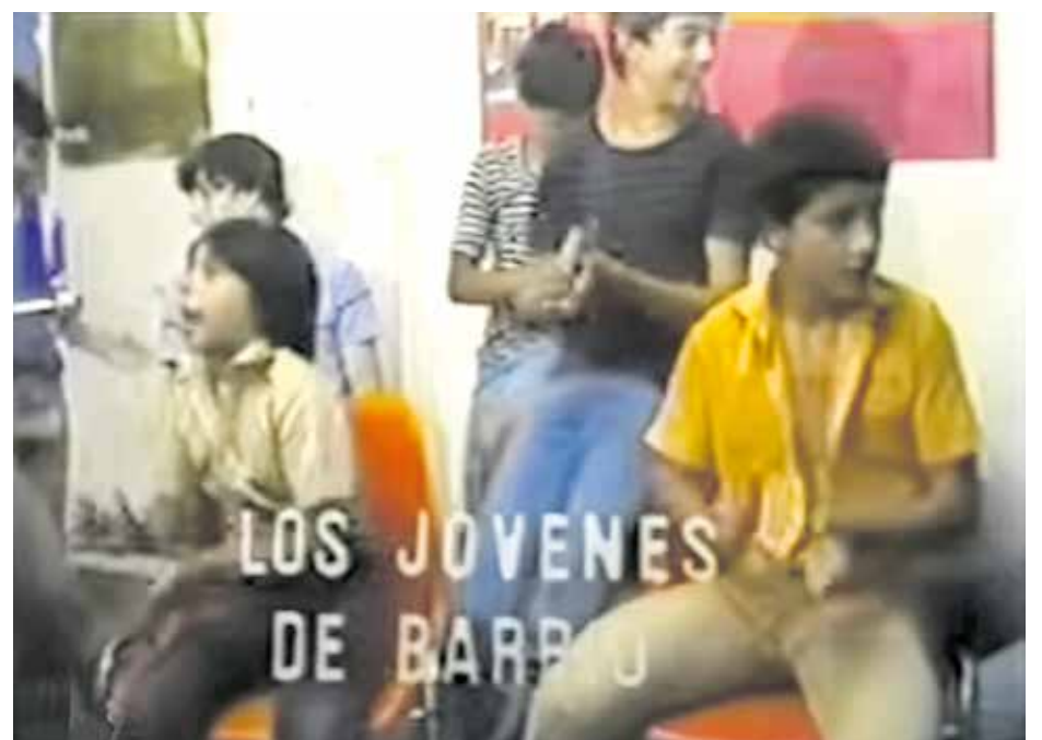
Un fotograma de 'Los jóvenes de barrio', gravat el 1982 a Canyelles.

Daniel Gasol Raig Verd Editorial, 2024 480 pàgines. 24,90 €